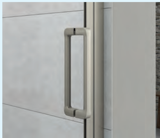
▲ Metalen handgreep binnen/buiten ▷ Poignée métallique intérieure/extérieure