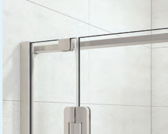
▲ Parallele muursteen ▷ Barre de renfort parallèle