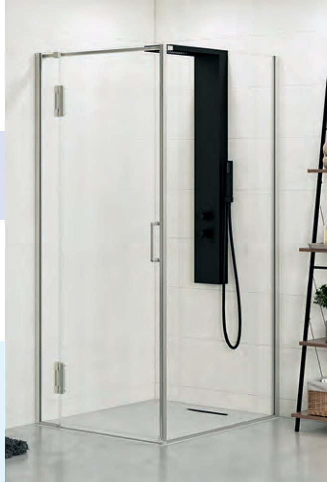
▲ EKINOX P+F Scharnieren links ▷ Vaste wand met profiel rechts ▷ Charnières à gauche ▷ Paroi fixe avec profilé à droite