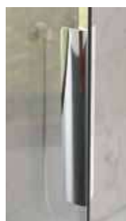
▲ Verchromde metalen handgreep ▷ Poignée métallique chromée

INFO ▶ Bij montage op een douchebak, ligt de vaste wand 2,2 cm naar binnen t.o.v. de douchebak. Bij montage op een tegelvloer dient u hiermee rekening te houden voor het te betegelen oppervlak, of u kunt kiezen voor maatwerk om de juiste maten te verkrijgen (zie p.276-277). ▶ Dans le cas d'une pose sur receveur, la largeur de la paroi intègre un retrait de 2,2 cm. Dans le cas d'une installation sans receveur, prendre en compte ce retrait pour déterminer la zone à carrelor ou opter pour des dimensions sur-mesure (voir p.276-277).