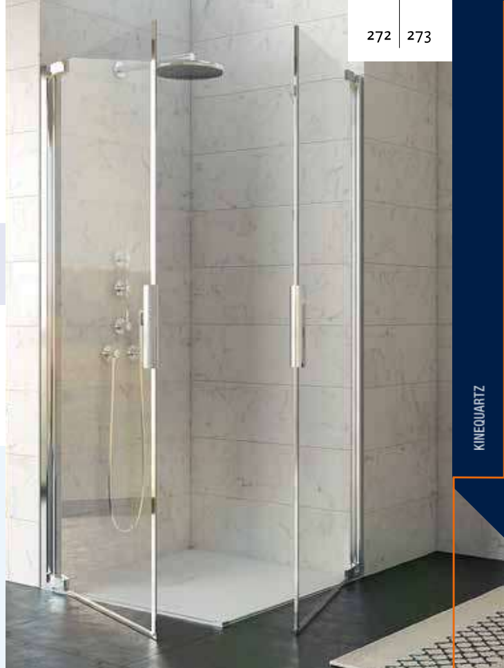
▲ KINEQUARTZ MET PROFIEL - A/P | PROFILÉ - A/P