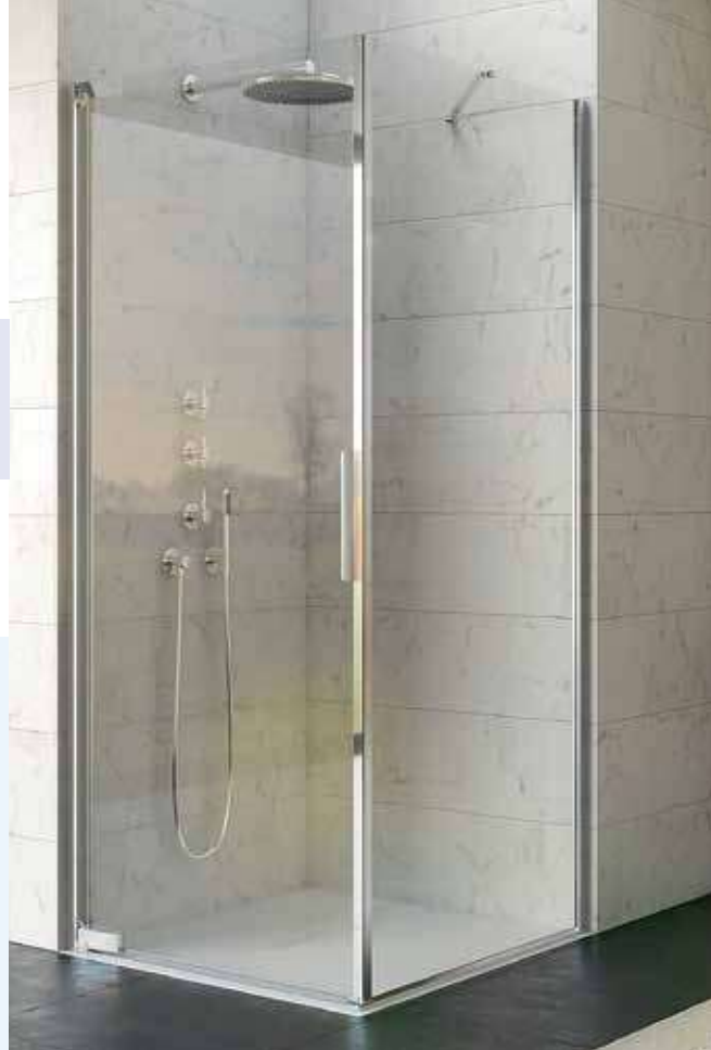
▲ KINEQUARTZ MET PROFIEL - P+F | PROFILÉ - P+F Afmeting deur ≤ 100 cm ► Scharnieren links ► Taille porte ≤ 100 cm ► Charnières à gauche