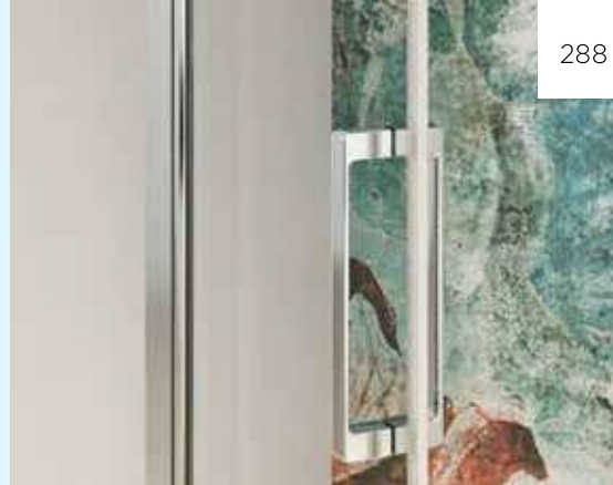
▲ Metalen handgreep binnenzijde/buitenzijde ▷ Poignée métallique intérieure/extérieure