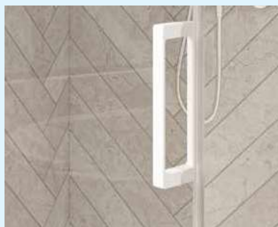
▲ Metalen handgreep binnenzijde/buitenzijde ▷ Poignée métallique intérieure/extérieure