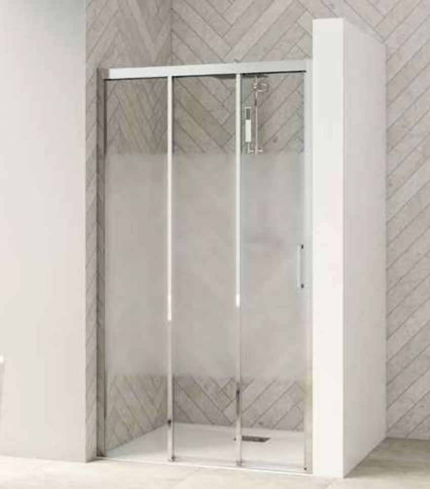
▲ SMART DESIGN 3V ZONDER DREMPEL | C SANS SEUIL ▷ Vast wanddeel links Verchromd profiel ▷ Cosmos glas ▷ Partie fixe à gauche ▷ Profilé chromé ▷ Verre cosmos